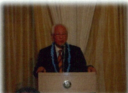
皆さんで手に手つないで