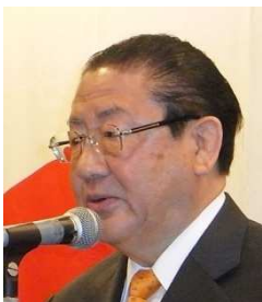
自民党総合政策研究所所長 元自民党副総裁