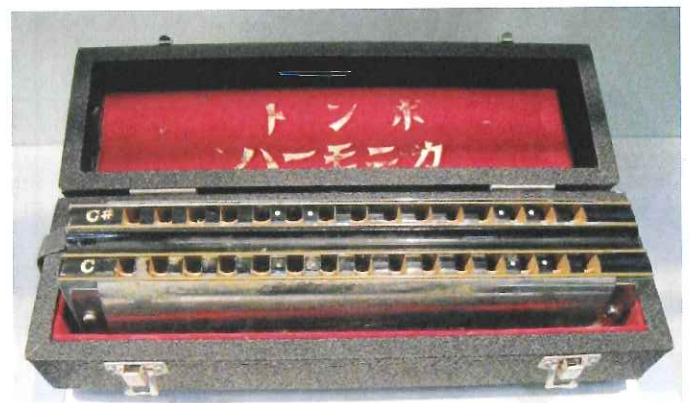
愛用のバスハーモニカが斎場入り口に展示してありました。