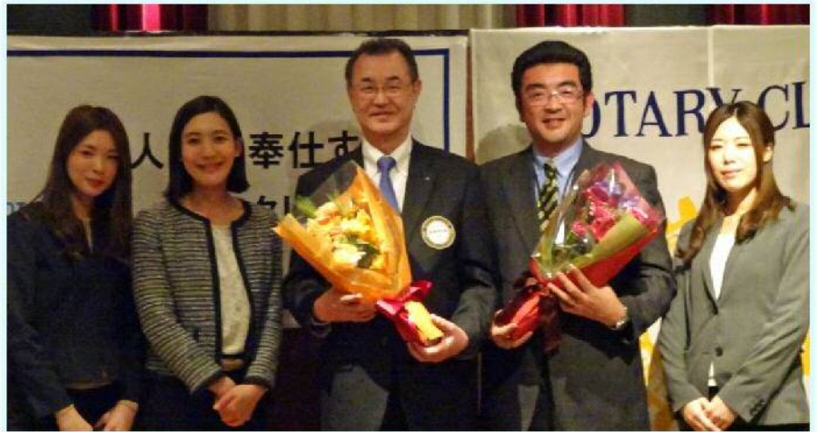
松嶋アクト幹事の挨拶