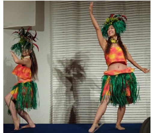
みんなでフラダンスを踊ろう～！！