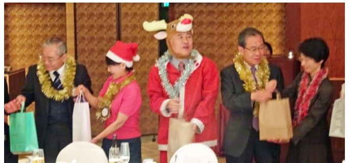
♪子ども達もプレゼント交換♪