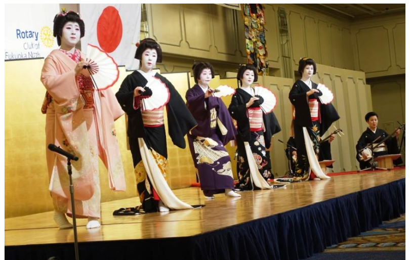
博多券番による祝儀舞