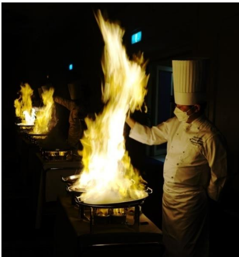
ステーキのフランベシヨ